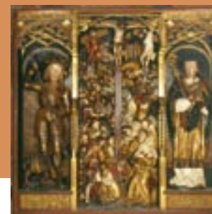
Volkmarsen-Külte, ev. Kirche, Schnitzaltar 1521