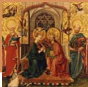
Aufenau, Mitteltafel um 1520 (Ausschnitt)

E-Mail: restaurator@weller-plate.de www.weller-plate.de