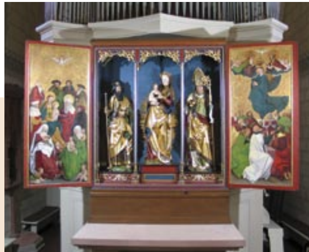
Niederweidbach, ev. Kirche Schnitzaltar, um 1510