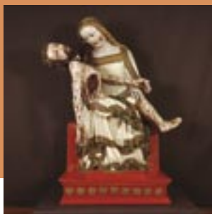
Fritzlar, Dom, Pietà um 1370